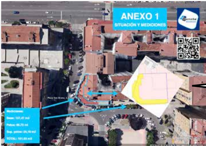
ANEXO 1 Situación aérea y mediciones